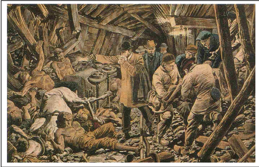
Les sauveteurs dans la mine de Courrière

ASSOCIATION DES AMIS DU MUSEE DE LA MINE